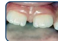
Tanden van het blijvend gebit hebben een kartelrand